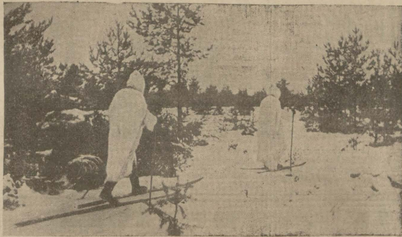
Sovyet Rusyada kızaklı muharibler

Vişi 26 (A.A.) — Hindistanda Kalkütadan alınan haberlere göre 16 İkincikanundan 20 Sonkânuna kadar simendiferle 600,000 kişi şehri terk etmiştir. Simendifer idaresi günde 100,000 kişinin tahliyesi için tedbirler ittihaz etmiştir.